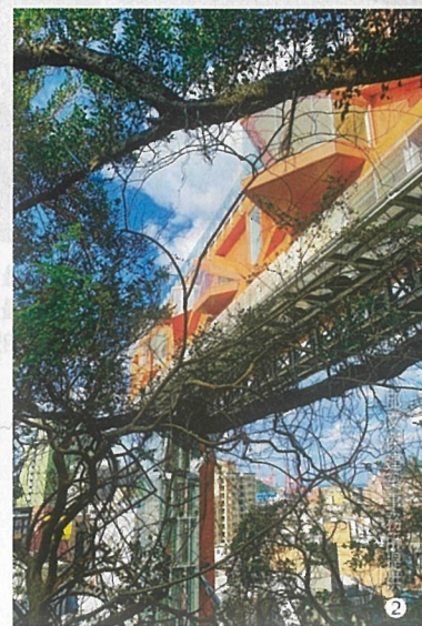
邱文傑建築事務所提供 2

代表之作 ①新竹東門城是市民經常出入使用的古蹟活化代表，如今還有都市滯洪池的功能。②預計今年開放的基隆塔，距基隆港、基隆廟口步行時間都不超過6分鐘，若能與山上主普壇商家、茶屋串聯，將形成新商圈。③六龜山地育幼院花了邱文傑10年的時間重建，溫潤的圓頂設計更能彰顯家的溫馨感。④改建的壽山動物園利用錐形的山屋，讓動物得以向上攀爬，多一點自由的空間。